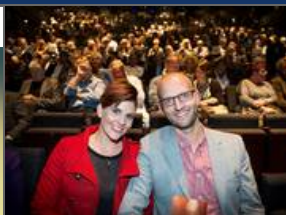
De ser på Beatles