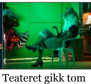
Teateret gikk tom