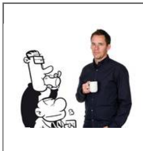
Ingen gratis "Lunch"