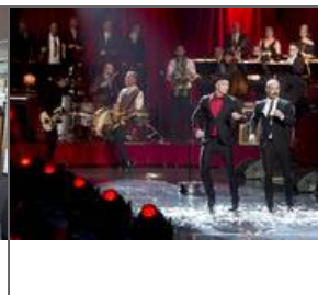
Millionutbytte for Kaizers