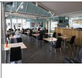
Flott fisk, behagelige priser